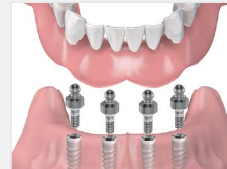
Einsetzen der Vollprothese mit "Druckknöpfen"