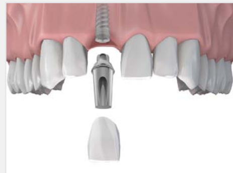
Erneuerung des Einzelzahnes