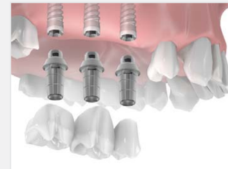
Einsetzen einer "Dreizahnbrücke" auf 2 Implantaten