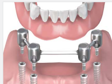
Einsetzen der Vollprothese mit "Stegversorgung"